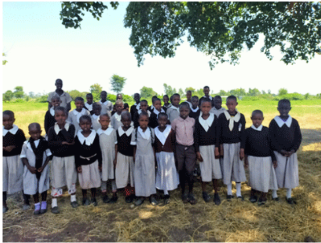
Matepes primary. MAA scolarise 50 enfants ici