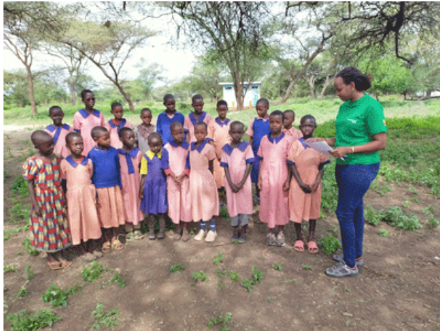
Orgumaek primary, MAA scolarise ici 27 enfants