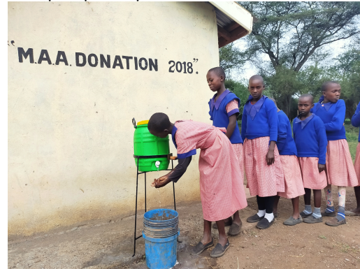
Introduction du lavage des mains à côté des WC dans une école rurale.