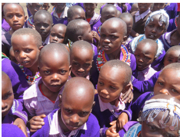
Quelques-unes de nos bénéficiaires