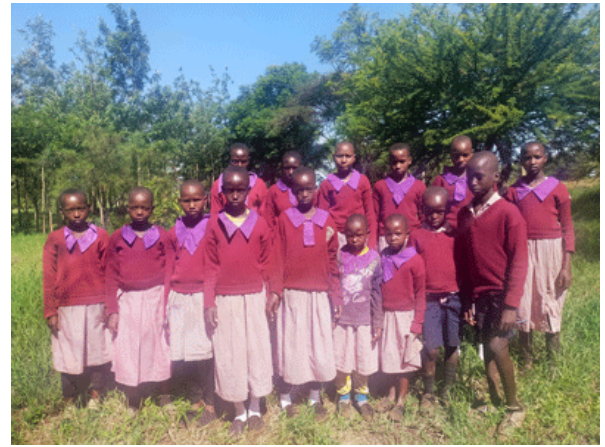
Olmapiu primary, MAA scolarise 18 enfants ici.